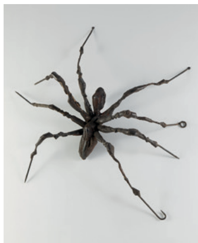
Photo © Centre Pompidou, MNAM-CCI, Dist. RMN-Grand Palais / Jean-François Tomasian © Adagp, Paris 2016

Paris, Centre Pompidou - Musée national d'art moderne / Centre de la création industrielle